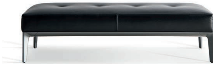
150X60 H 38 WITH FEET