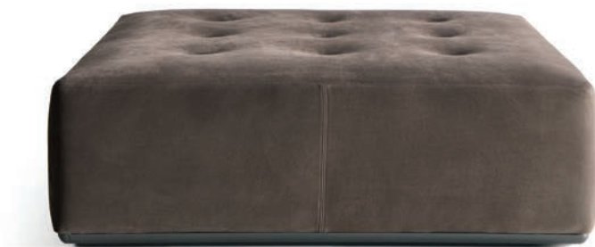
120X120 H 38 AVAILABLE ALSO 90X90 H38