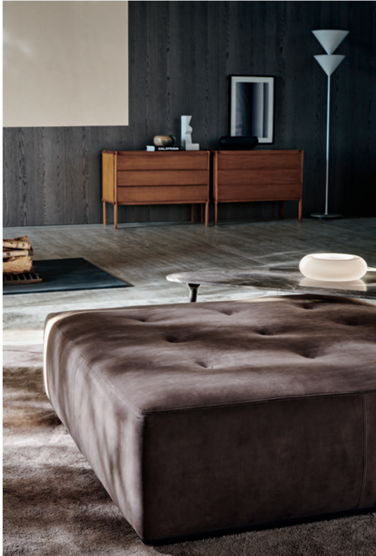
NEW COLLECTION 2018

POUF EUSTON— TESSUTO SCIROCCO SD935 CASSETTONI MHC.1—