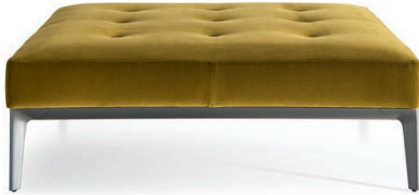
120X120 H 38 WITH FEET